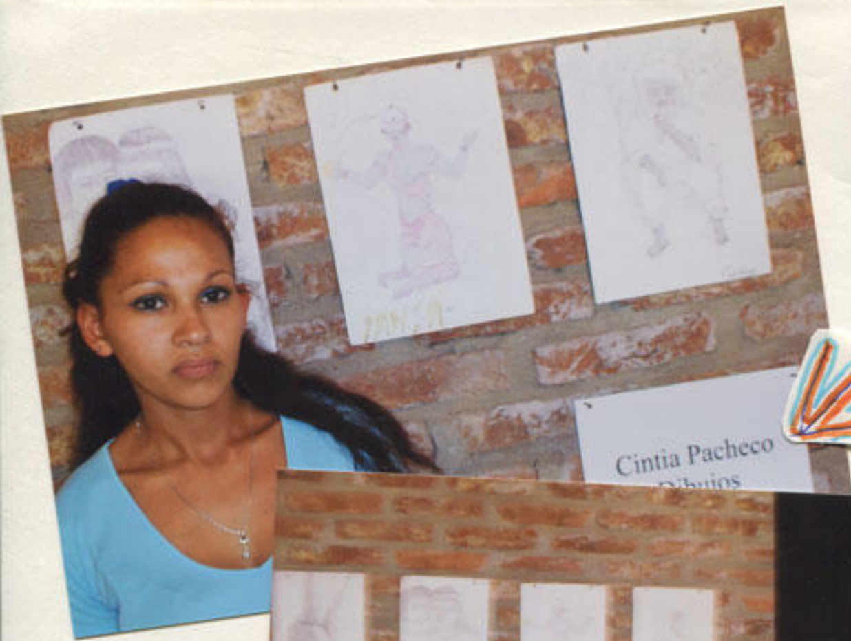
Cintia Pacheco Dibujos