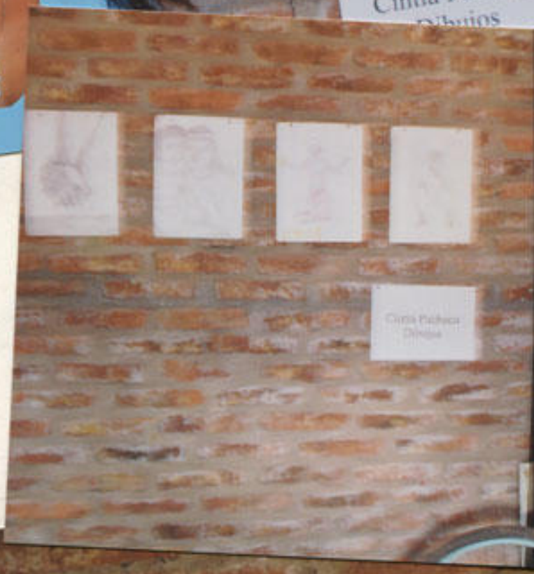
Cintia Pacheco Dibujos